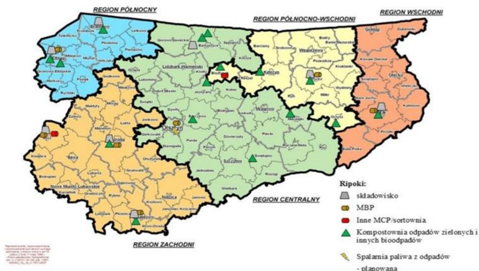
Ryc.1 Podział województwa Warmińsko-Mazurskiego na Regiony wraz z lokalizacją instalacji komunalnych (RIPOK) oraz instalacji do termicznego przekształcania odpadów z przetworzenia odpadów komunalnych w województwie warmińsko-mazurskim.

Sejmik województwa warmińsko-mazurskiego uchwałą XXIII/523/16 z dnia 28 grudnia 2016r. uchwalił Plan Gospodarki Odpadami dla Województwa Warmińsko-Mazurskiego na lata 2016-2022 (zmieniony uchwałą Nr VIII/152/19 Sejmiku Województwa Warmińsko-Mazurskiego z dnia 17 czerwca 2019 r.). PGO dzieli nasze województwo na pięć Regionów (Północny, Zachodni, Centralny, Północno-Wschodni, Wschodni).