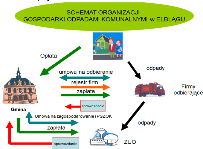
Ryc. 3 Schemat organizacyjny gospodarki odpadami komunalnymi w Elblągu.

Schemat organizacyjny Gospodarki Odpadami Komunalnymi w Elblągu w 2021 roku przedstawia poniższa rycina. Schemat ten obowiązuje od 01.07.2013r.